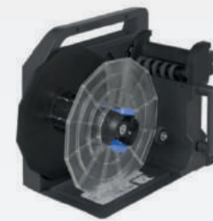
TU-RC7508 (Accesorio opcional - no viene incluido)